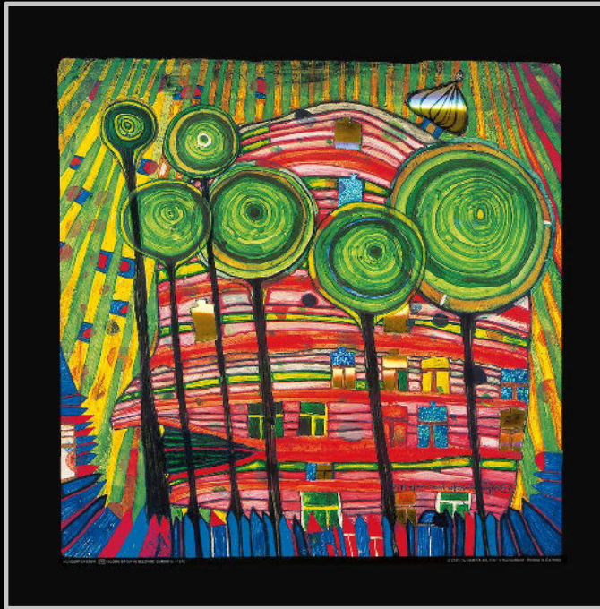
Nach HUNDERTWASSER 745 · DINGS DAS WACHSEN IN GELIEBTEN GÄRTEN © 2017 NAMIDA AG, Glarus/CH

In den Räumlichkeiten des Hauses oberhalb des Floristikbetriebes befindet sich auch ein kleiner Galeriebereich in dem regelmäßig wechselnde Ausstellungen zu verschiedenen Themen rund um Hundertwassers Wirken stattfinden. Gezeigt werden hierbei Originalgrafiken, Kunstdrucke, Repliken, Umweltschutzposter, Architektur fotografien und von Hundertwasser entworfene Alltagsgegenstände. Ziel der Ausstellungen ist es dabei immer dem Besucher Hundertwassers Gedanken gut näher zu bringen und zu einem weltkritischeren Denken und naturschonendem Leben anzuregen.